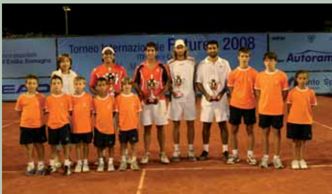
Vincitori e Finalisti del doppio insieme agli infaticabili Raccattapalle!