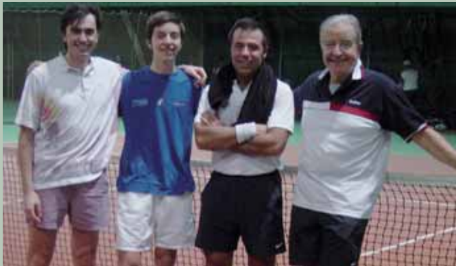
Torneo Stellare..i primi 4 classificati della categoria Maschile "B"