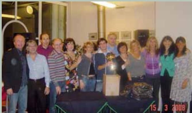
Torneo dell'amicizia...ancora campioni!