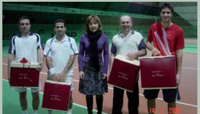
Torneo Stellare..I primi 4 Uomini della Categoria "A"!!