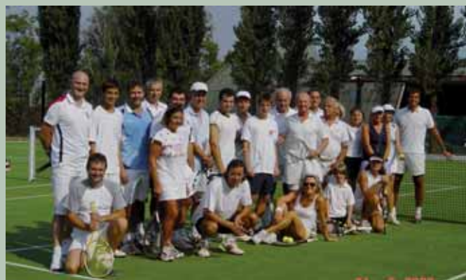
I soci partecipanti all'inaugurazione dei nuovi campi