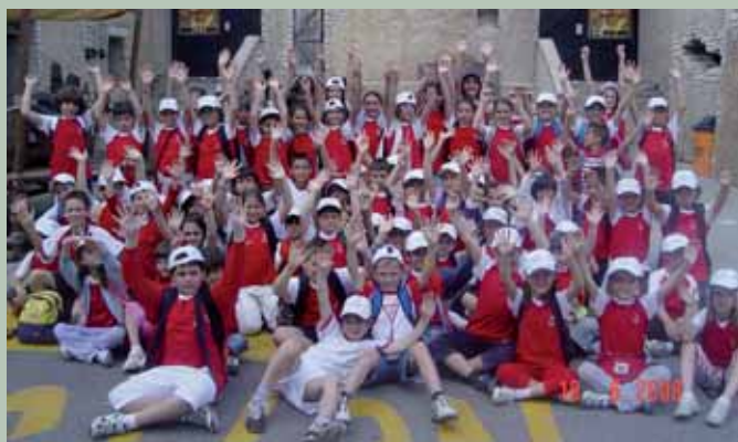
Il nostro Centro Estivo