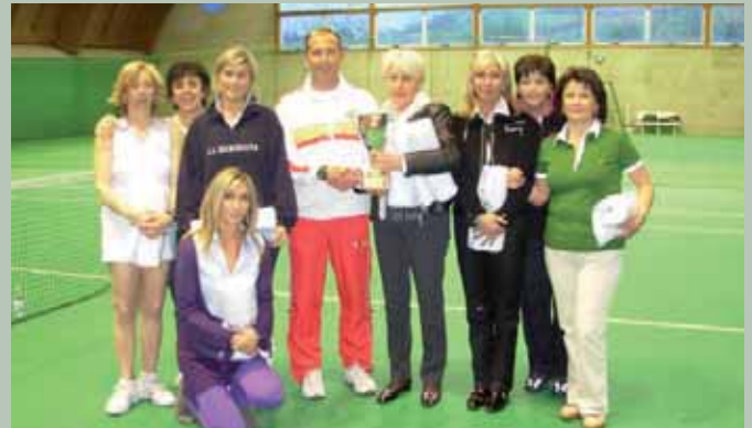
Campionato Interladies: le nostre socie tornano al successo