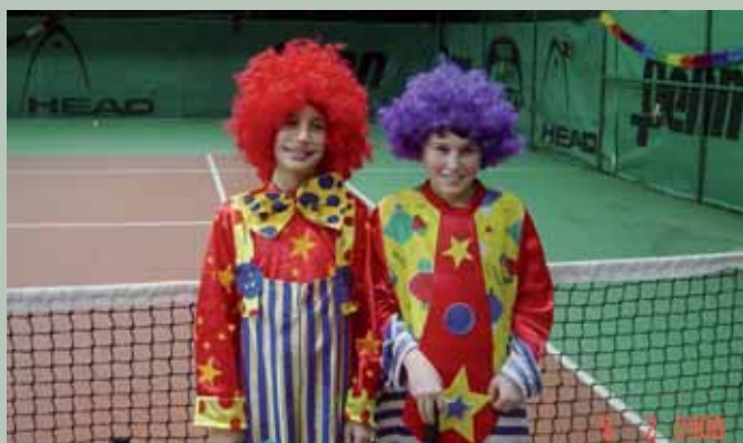
I più Belli....!