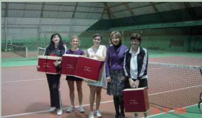
Torneo Stellare..le prime 4 donne classificate!