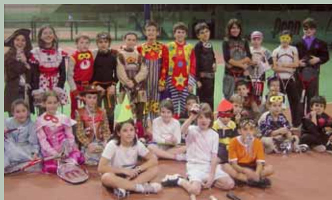
la Festa di Carnevale in campo!