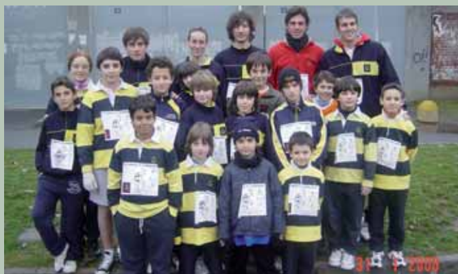
La Scuola Tennis alla corrida di S.Geminiano