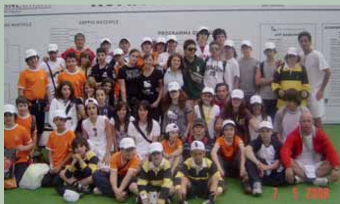
La Scuola Tennis in gita a Roma.