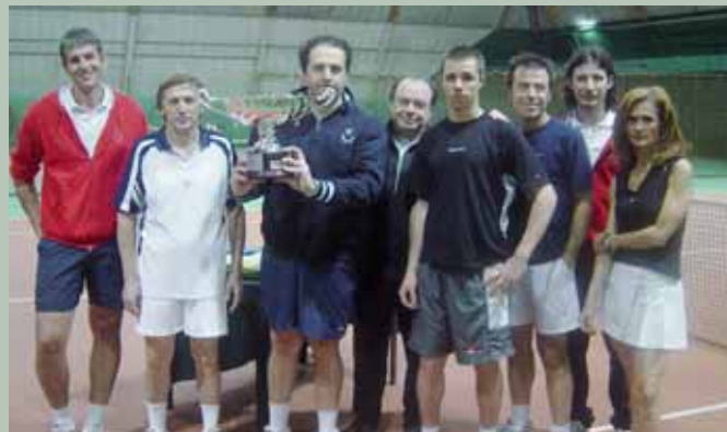
Meridiana's Cup...la Squadra vincitrice!