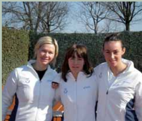
La Squadra Femminile di Serie B

ragazzi della scuola tennis di confrontarsi con altri ragazzi della stessa età per farli crescere e divertire gareggiando. A questo punto non ci resta che augurare un grosso "in bocca al lupo" a tutti i nostri atleti, grandi e piccini, e invitare tutti i soci a sostenere e incoraggiare i nostri ragazzi che come sempre difenderanno i colori del Circolo in giro per l'Italia. Cogliamo l'occasione per anticipare che, in occasione delle gare casalinghe delle nostre Squadre, la disponibilità dei campi sarà limitata.