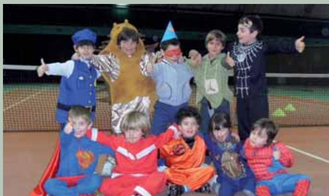
Gli allievi della Scuola Tennis

Come ogni tradizione che si rispetti, anche quest'anno i maestri e gli allievi della Scuola Tennis del nostro Club hanno festeggiato insieme il carnevale 2009, svolgendo le lezioni di tennis di Lunedì 23 e Martedì 24 Febbraio simpaticamente vestiti da carnevale. La festa, alla quale hanno partecipato numerosi bambini, si è svolta nei campi in moquette del Club, dove è stato possibile organizzare gare e giochi di gruppo relativi al tennis. La fantasia dei maestri e la complicità dei bambini ad immedesimarsi nei vari personaggi carnevaleschi, hanno contribuito a rendere due giornate di normale scuola tennis molto divertenti e allo stesso tempo educative perché impostate all'insegna dello sport.