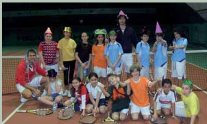
I maestri e gli allievi della Scuola Tennis