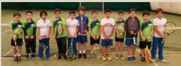
Nella foto i protagonisti dell'amichevole tra il Club La Meridiana e la Pol. Maranello

L'iniziativa proposta dai maestri del Club, è giunta a "penello" per testare lo stato di preparazione dei giovani atleti in vista del campionato