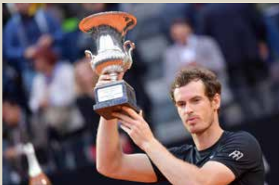
Il vincitore nel 2016 Andy Murray

sulla terra rossa dopo gli Open di Francia (ROLLAND GARROS). Fanno parte del circuito ATP World Tour Masters 1000, che raggruppa i 9 tornei più prestigiosi dopo i 4 del Grand Slam.