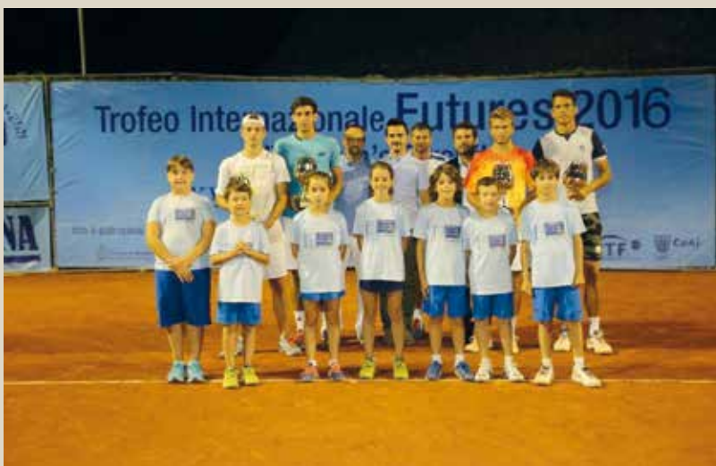
Vincitori e finalisti della gara di doppio con i dirigenti ball e boys (ed. 2016)