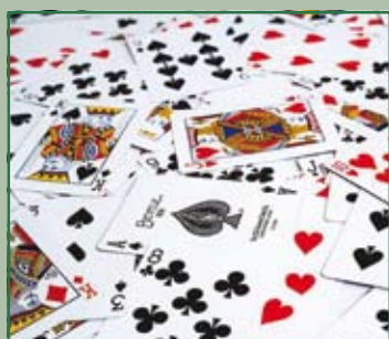
Torneo di bridge Ghirlandina