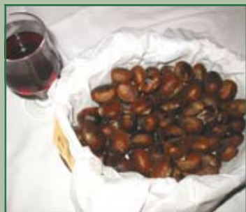
Festa di San Martino