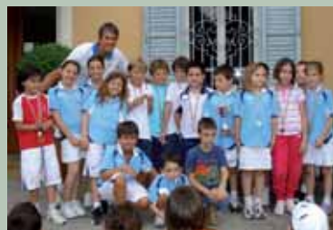
GRUPPO BABY CUP