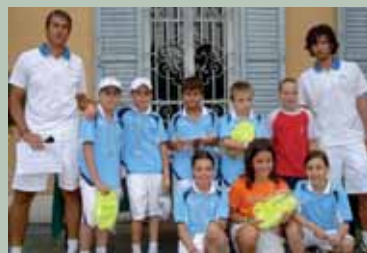
GRUPPI MINI TENNIS E JUNIOR