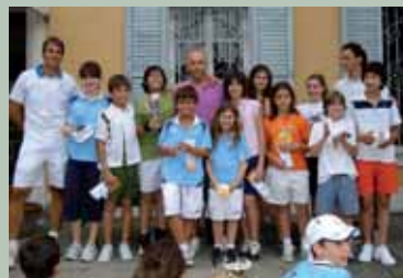
Alcuni vincitori del Torneo di Fine S.A.T.