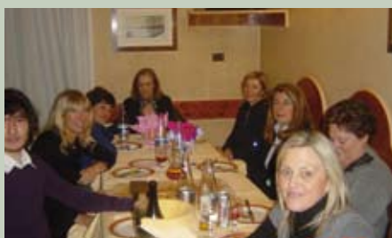
Tutti a cena...