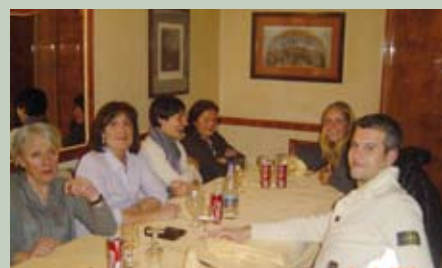
Tutti a cena...