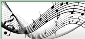
Concertino Scuola di Musica Pistoni