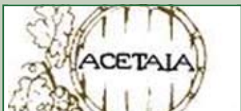
Visita guidata all'Acetaia

Cena e musica con deejay Sabato 17 aprile ore 20,00