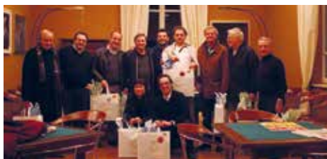
Torneo di briscola