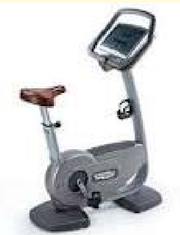
NEW BIKE 500

La palestra del Club si è dotata di nuove attrezzature.