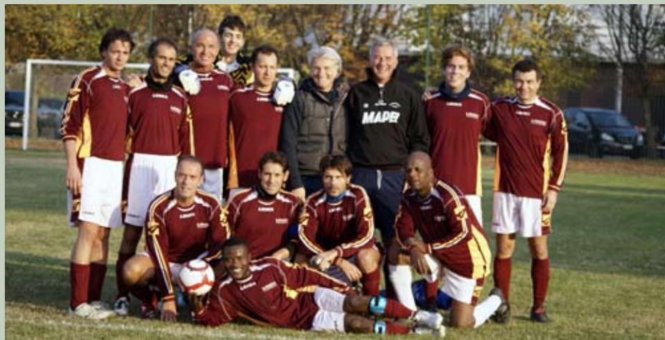
La Meridiana Club dilettanti girone B

Alla squadra di calcio della Meridiana un grosso in bocca al lupo per il prosieguo del campionato.