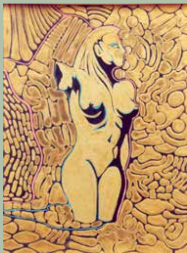
di Massimo Giacchero