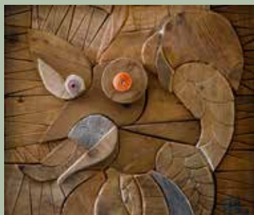
di Ennio Bastiani