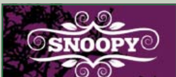
Meridiana Disco Night venerdì 26 febbraio ore 22,00