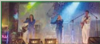
"Abba Show" sabato 27 febbraio ore 21,30