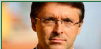
Raffaele Cantone giovedì 18 febbraio ore 21,15