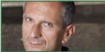
Gianrico Carofiglio venerdì 12 febbraio ore 21,15

Tassa riscossa e Tax Percue Stampa: Poligrafico Mucchi • Modena • Via Emilia Est 1525 Stampato in 1200 copie chiuso il 19-01-2010 Spedizione in a.p. 45% art. 2 comma 20/B Impaginazione: Colorgraf - Vignola (Mo) - tel. 059 776576 Euro 0,50