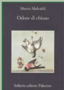
Odore di Chiuso