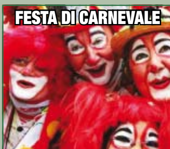
FESTA DI CARNEVALE