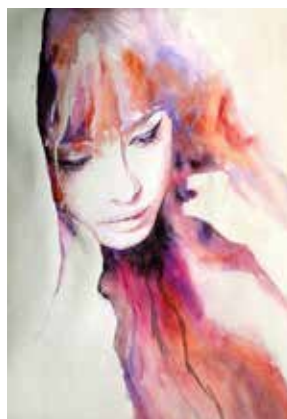
Acquerello di Santa Sammartino