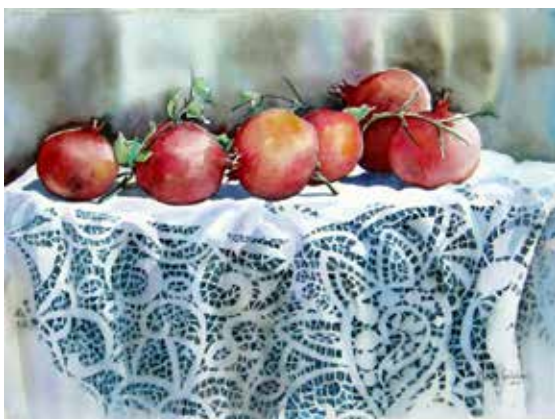
Acquerello di Meris Goldoni