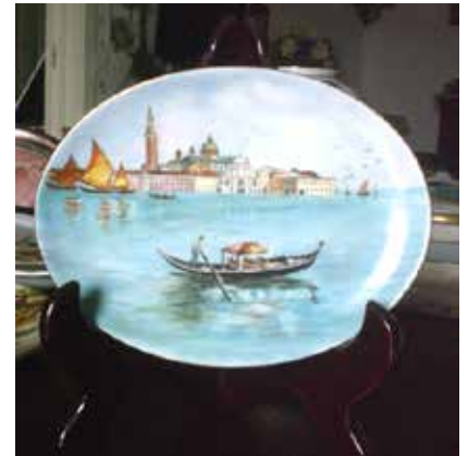
Vassoio dipinto a mano. Daniela Bettoni