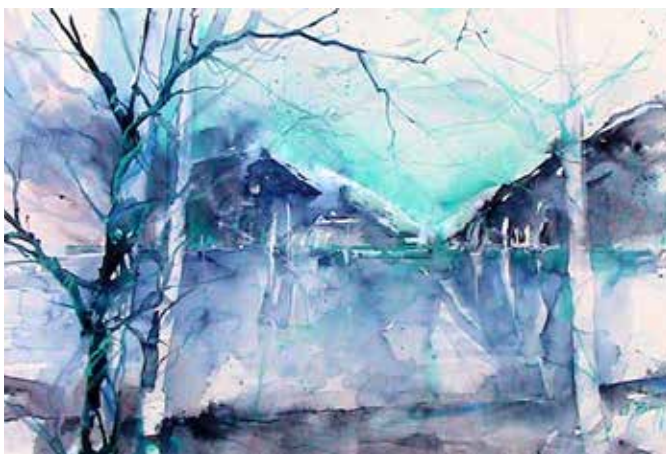
Acquerello di Adriana Buggino