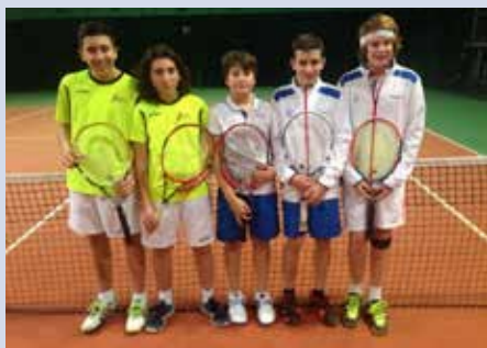
In maglia gialla i giocatori del team Libertas di Fiorano e in maglia bianca gli atleti del Club La Meridiana