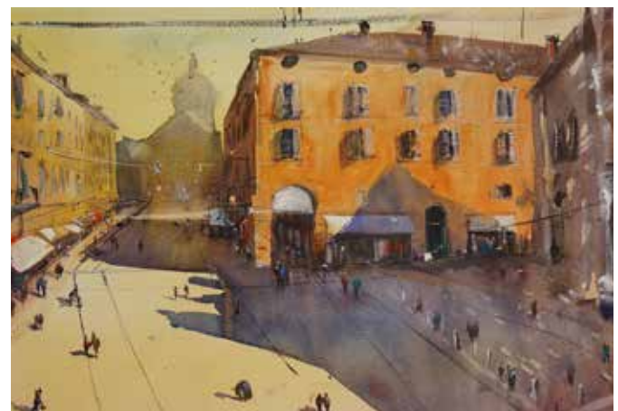
Acquerello di Geremia Cerri