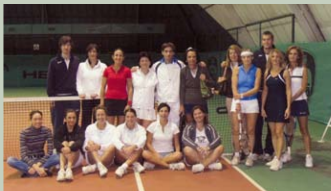
Le Partecipanti al 1° Open Ladies Challenger