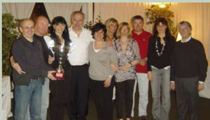
Torneo dell'Amicizia... ancora Campioni!!