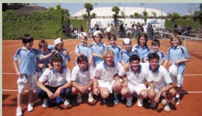
La Squadra di Serie B maschile promossa in A2

Messaggio pubblicitario con finalità promozionali. Per tutte le condizioni contrattuali si rinvia ai fogli informativi a disposizione della clientela presso ogni filiale della Banca o sul sito web www.bper.it