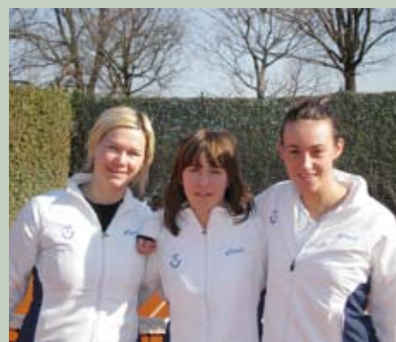
La Squadra di Serie B Femminile