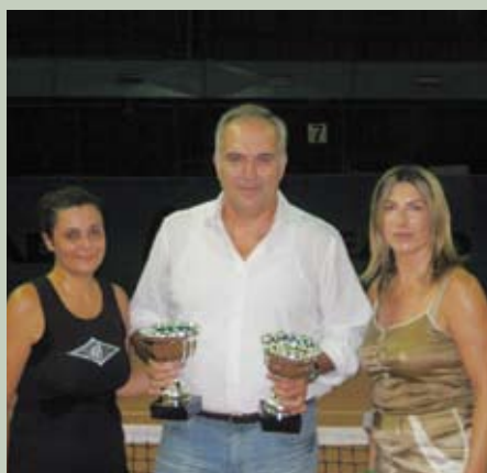
Torneo Sociale 2009... Finaliste del Doppio Femminile