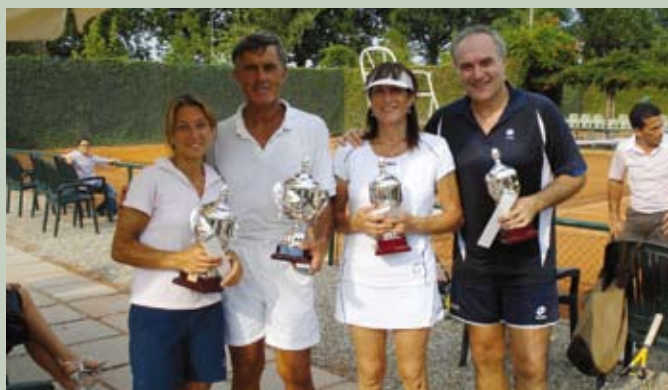
Torneo Sociale 2009.... Vincitori e Finalisti del doppio misto