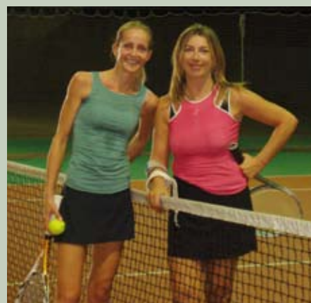
Vincitrice e Finalista del singolare

Si Replica...!!!! Torneo di tennis "2° OPEN LADIES CHALLENGER"