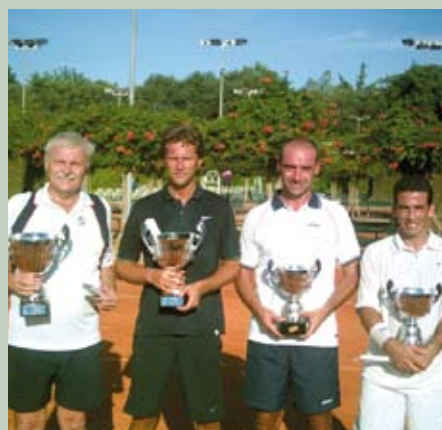
Torneo Sociale 2009... Vincitori e Finalisti del Doppio Maschile