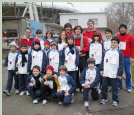
La Scuola Tennis alla Corrida di S. Geminiano