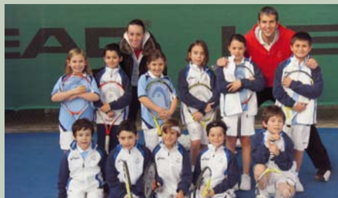
Alcuni baby giocatori...