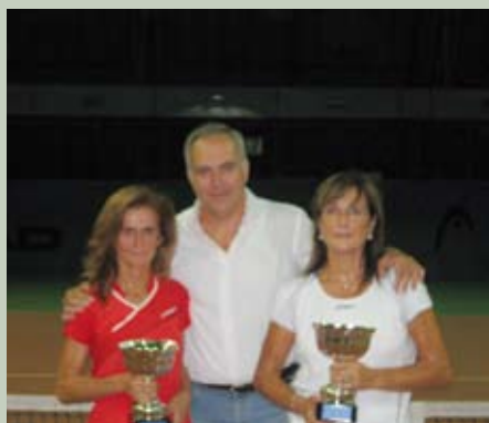
Torneo Sociale 2009.... le Vincitrici del doppio femminile