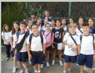
Una piccola pausa