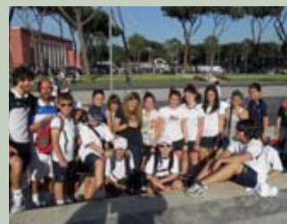
Momento di relax in attesa dell'apertura dei cancelli