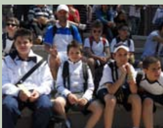
I ragazzi a studiare i campioni