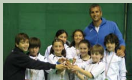
Finalmente le Medaglie