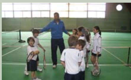
Ultimi consigli prima della Finale

ottimo secondo posto con i ragazzini under 8, sfiorando la Medaglia d'oro di un soffio, mentre i ragazzini under 10 si sono classificati al 5° posto. Un ringraziamento particolare va ai genitori che si sono sempre resi disponibili ad accompagnare e seguire i loro figli, ma l'applauso più forte va proprio ai bambini che sono stati splendidi, sia nelle vittorie che nelle sconfitte e che, con la loro simpatia e allegria hanno trasformato le giornate di gara in momenti di gioia. L'appuntamento è già proiettato al 2012, quando la Meridiana, come ha sempre dimostrato, sarà presente a tutte le competizioni che coinvolgono i ragazzini della Scuola tennis.