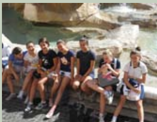
Le nostre ragazze... a riposo