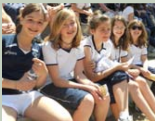
Le nostre ragazze in tribuna

lo svedese Soderling e lo spagnolo Verdasco, che dopo più di due ore di gioco e dopo una grande spettacolo si è conclusa a favore del primo. Mercoledì mattina, dopo una nottata un po' rumorosa, in attesa dell'apertura dei cancelli, due passi in centro ad ammirare la bellissima Piazza di Spagna e la Fontana di Trevi e poi di nuovo grande tennis. Per alcuni ragazzi c'è stata la possibilità di visitare le zone riservate solo ai giocatori, per chiedere autografi e scattare fotografie inedite, e dopo un altro pomeriggio sotto il sole, felici di aver trascorso una giornata divertente tutti insieme all'insegna dello sport allo stato puro, è stata la volta del ritorno, con i ragazzi distrutti dalla stanchezza ma sicuramente appagati e soddisfatti di questa bella gita.