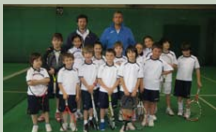
I ragazzi che hanno disputato la Finale