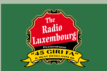
"45 giri fa" sabato 25 giugno ore 21,30