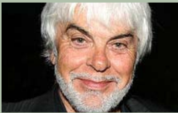
Valerio Massimo Manfredi giovedì 16 giugno ore 21,15