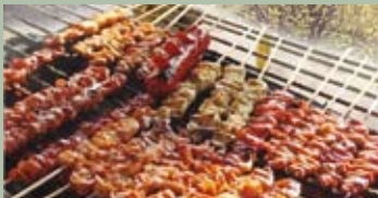
BBQ di beneficenza sabato 18 giugno ore 20