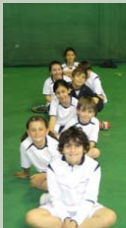
Alcuni dei nostri ragazzi

Come tutti gli anni passati, anche nel 2011 la Meridiana ha voluto partecipare al Campionato denominato Baby Cup, una competizione riservata a tutti i ragazzi più piccoli della scuola tennis che, in questi 4 mesi, hanno avuto la possibilità di sfidare ragazzini coetanei di altri circoli della provincia di Modena in gare e partite in campi di dimensioni proporzionate in base alle varie età dei ragazzi. Grande è stata la passione che ci hanno messo questi bellissimoi bambini e grande è stato l'entusiasmo dei maestri che li hanno sempre accompagnati e sostenuti. Nelle finalissime, che si sono svolte allo Sporting Club Sassuolo, la Meridiana ha raggiunto un