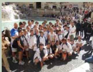
Foto di gruppo alla Fontana di Trevi