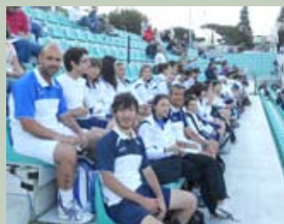
I ragazzi durante la sessione serale