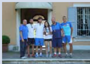
perfezionamento e specializzazione femminile