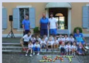
psicomotricità e mini tennis