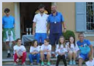
perfezionamento e specializzazione u. 12 femminile