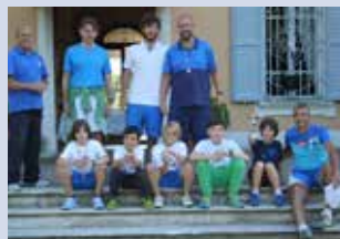
u. 10 e 12 maschile