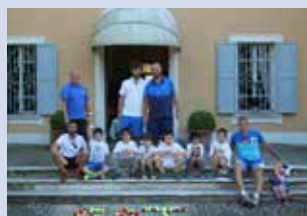
u. 10 maschile