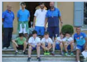
perfezionamento e specializzazione u. 12 maschile