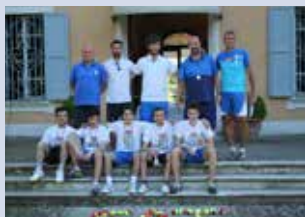
perfezionamento e specializzazione maschile

Giovedì 19 maggio, si sono disputate le finali del campionato "scuole tennis" nelle categorie kid e young. In entrambe le finali le nostre squadre hanno affrontato i coetanei del Mammut Club. I nostri atleti hanno raggiunto le finali di entrambe le categorie dopo aver superato un girone di qualificazione contro diverse rappresentative, classificandosi al 1° posto, mentre in semifinale hanno sconfitto il tennis club Fiorano ed in finale l'Olimpic Tennis Zeta Due. La partita conclusiva ha regalato due match avvincenti e combattuti e, se nella categoria dei più grandi, young cup, la nostra squadra è stata sconfitta nonostante la