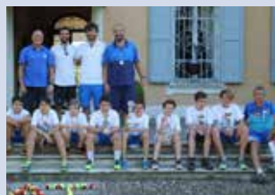
perfezionamento e specializzazione u. 12 e 14 maschile