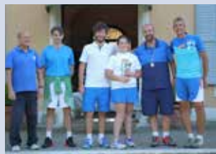
perfezionamento e specializzazione 4 under

grinta dimostrata in tutti i match, il team dei più piccoli, kid cup, ha avuto la meglio su quella del Mammut con una vittoria emozionante, annullando anche un match point nel doppio decisivo. A coronamento di tutto, la premiazione, con medaglie e coppe, dei ragazzi che nelle ultime settimane hanno partecipato e si sono dati battaglia nell'avvincente torneo di fine corsi. Per quest'anno la s.a.t. vi saluta e vi dà appuntamento a settembre per un nuovo inizio, mentre per chi desidera rimanere in nostra compagnia, ricordiamo che dal 6 giugno riparte il nostro centro estivo con tante avvincenti sorprese.