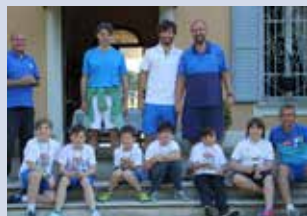
u. 10 mini tennis plus maschile