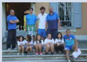
u. 10 femminile