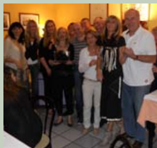
I festeggiamenti per il trionfo