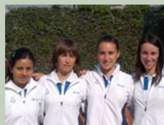
La Squadra Femminile

Anche la Serie B ha trionfato sul campo della Meridiana battendo con il punteggio di 4/0 il Circolo Tennis La spezia.