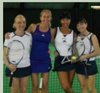
La Mavi e l'Ellis insieme alle avversarie