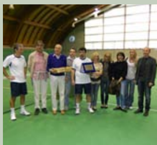
Foto di gruppo durante la premiazione