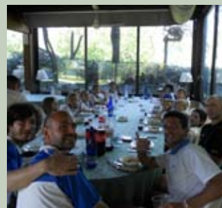
Pausa pranzo prima dei doppi