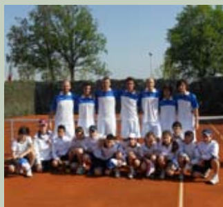
La Squadra insieme ai Raccattapalle