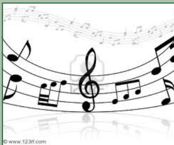
W la musica martedì 17 maggio ore 19,00