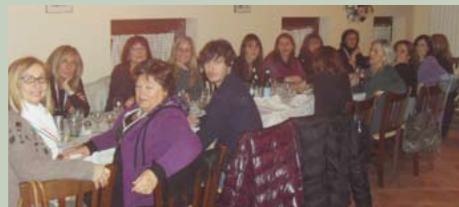
E a seguire tutti a cena in compagnia.....!!!!

Messaggio pubblicitario con finalità promozionali. Per tutte le condizioni contrattuali si rinvia ai fogli informativi a disposizione della clientela presso ogni filiale della Banca o sul sito web www.bper.it