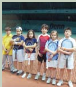
I nostri ragazzi under 10