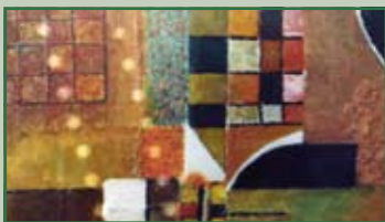
Mostra di pittura Sabato 13 marzo ore 16,00 (inaugurazione)