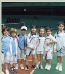
I nostri under 8 insieme ai loro coetanei dello Sporting Sassuolo