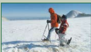
“Ciaspolata sul monte Cusna” Domenica 21 marzo