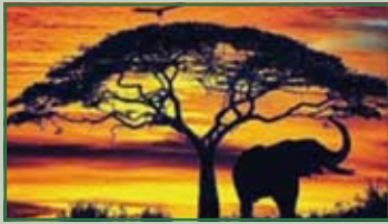
“Storie di mesi africani” Giovedì 3 marzo ore 21,00

Tassa riscossa e Tax Percue Stampa: Poligrafico Mucchi • Modena • Via Emilia Est 1525 Stampato in 1200 copie chiuso il 22-02-2010 Spedizione in a.p. 45% art. 2 comma 20/B Impaginazione: Colorgraf - Vignola (Mo) - tel. 059 776576 Euro 0,50