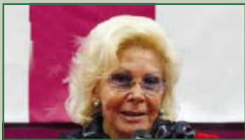
Lea Pericoli Venerdì 19 marzo ore 21,15