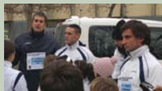
Ultimi consigli prima del via