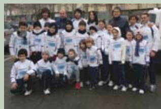
Il gruppo prima della partenza