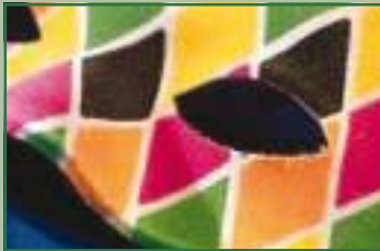
Festa di Carnevale sabato 5 marzo ore 21,30

Stampa: MC offset • Modena • Via Capilupi, 31 Tel. 059 364156 - Fax 059 3683978 Impaginazione: Colorgraf - Guiglia (Mo) - Tel. 059 700301 Euro 0,50