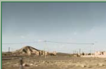
Fabrizio Gruppini mostra di fotografia 5-19 marzo