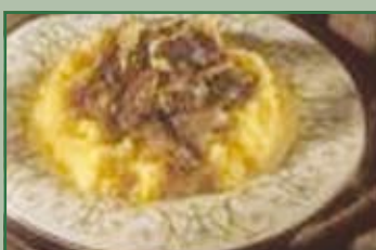
Mini-polentata solidale domenica 20 marzo ore 20,00