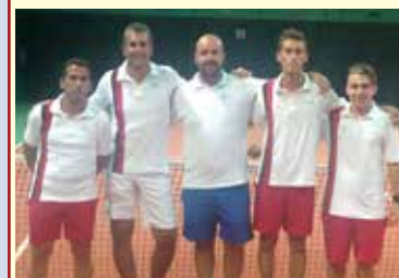
Alcuni dei partecipanti ai campionati a squadre del Club

In bocca al lupo a tutti i protagonisti.