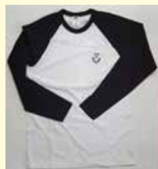
T-shirt a manica lunga