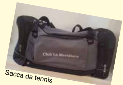
Sacca da tennis