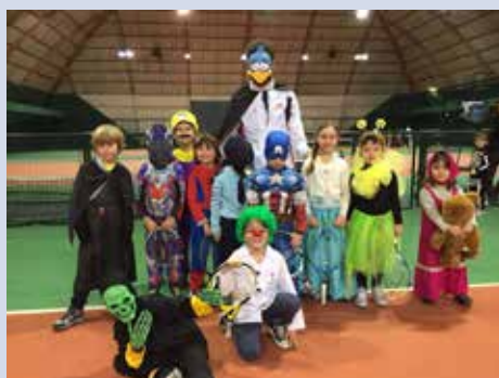
Alcuni momenti della festa di carnevale con gli allievi della S.A.T.