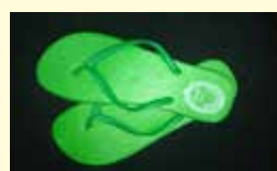
Ciabatte da doccia