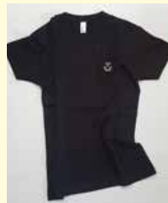
T-shirt a manica corta SLIM