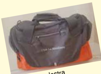
Sacca da palestra

Ricordiamo ai Soci che la boutique del Club, dispone di una nuova serie di articoli sportivi personalizzati e in vendita presso la Segreteria Sportiva.