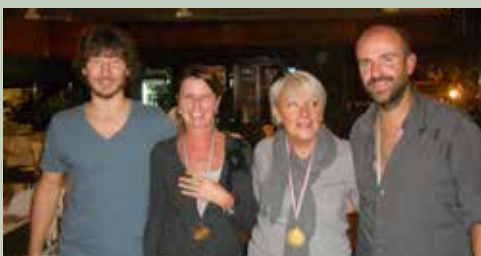
Premiazione doppio giallo femminile