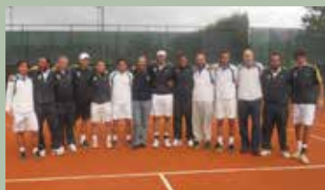
La Meridiana insieme alla fortissima Squadra del Circolo Canottieri Aniene di Roma