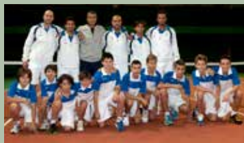
Foto della Squadra insieme ad alcuni raccattapalle

Stampa: MC offset • Modena • Via Capilupi, 31 Tel. 059 364156 - Fax 059 3683978 Impaginazione: Colorgraf - Guiglia (Mo) - Tel. 059 700301 Euro 0,50