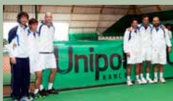
Un Grazie anche alla Banca Unipol