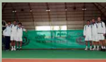
e... all'acetificio Ortalli