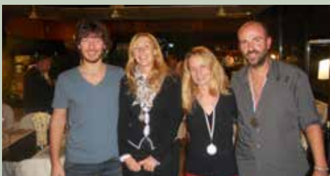
Premiazione doppio giallo femminile

coppie al termine di ogni tie-break. Dopo circa 90 minuti gli otto tennisti con più punti vinti nei tie-break si sono affrontati nelle semifinali e poi nella finale 1°/2° posto e 3°/4° posto al meglio di un set ai 6 game.