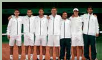
La Squadra del Circolo Tennis Parioli