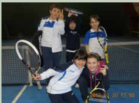
Squadra Under 10 Baby Cup

Un grande "in bocca al lupo" a tutti i nostri atleti.