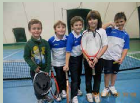
Squadra Under 8 Baby Cup