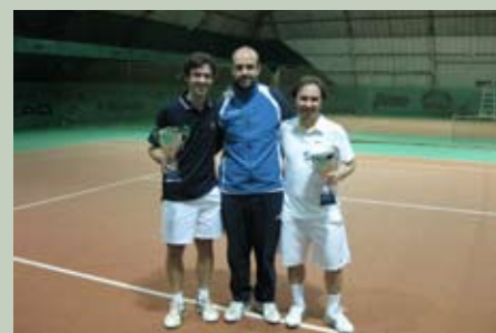
Vincitori Torneo Sociale di doppio