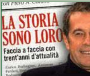
Giovanni Minoli giovedì 21 aprile ore 21,15