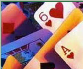
Burraco e Pinnacolo Pasquali venerdì 15 e domenica 17 aprile