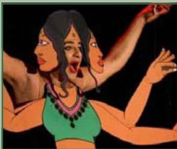
Ennio Marchetto sabato 16 aprile ore 22,00