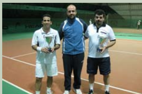
Finalisti Torneo Sociale di doppio