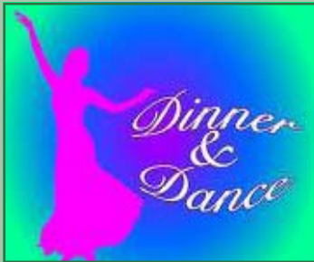
Dinner&Dance sabato 9 aprile ore 20,00

Stampa: MC offset • Modena • Via Capilupi, 31 Tel. 059 364156 - Fax 059 3683978 Impaginazione: Colorgraf - Guiglia (Mo) - Tel. 059 700301 Euro 0,50