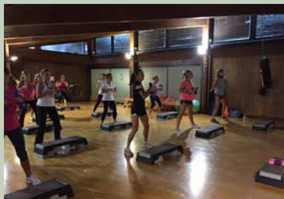
Un gruppo di socie durante una lezione di Step and Tone