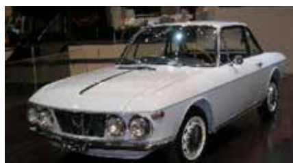
Lancia Fulvia coupè

panti le vetture che del pubblico presente.