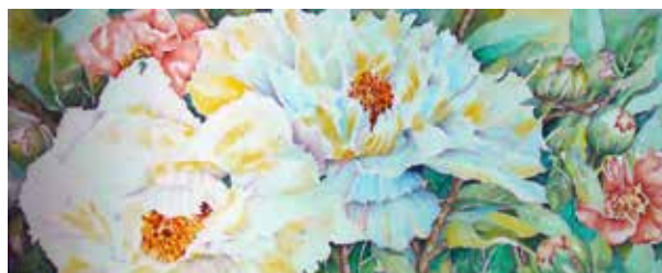
Acquerello di Francesca Capelli