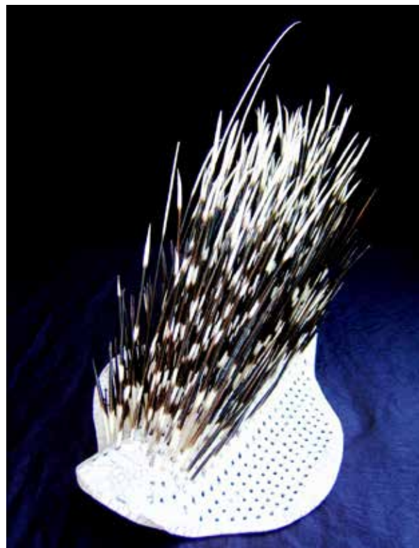
HYSTRIX. Tributo ad Oscar Niemeyer. Scultura design in ceramica di Maurizio Tangerini