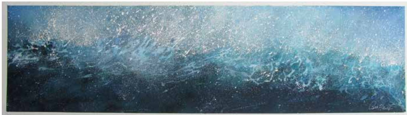
Nell'Onda. Acquerello di Massimo Ciavarella.