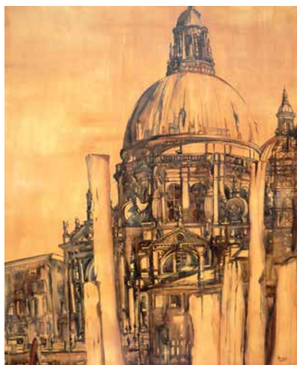
Maurizio Tangerini. S.M. della Salute VE acquerello e inchiostro su tela.