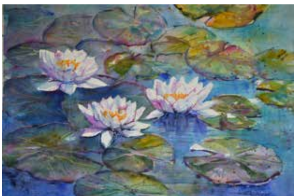
Acquerello di Loretta Fedrigo