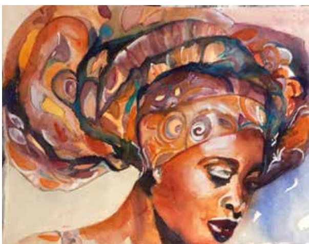
Acquerello di Federica Maffezzoni