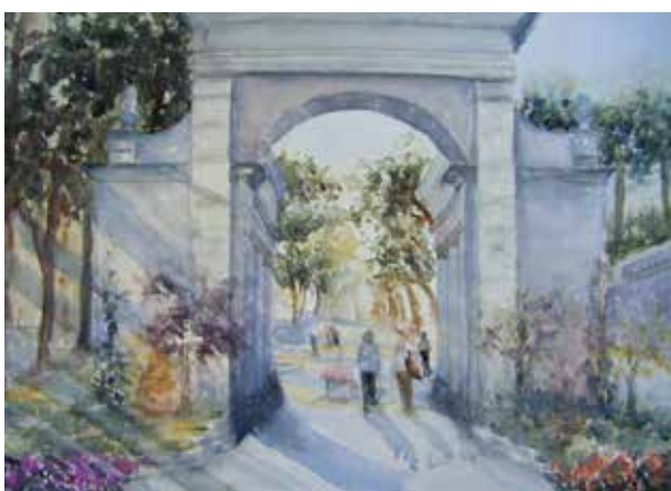
Lido degli Estensi. Acquerello di Lucia Grigolo