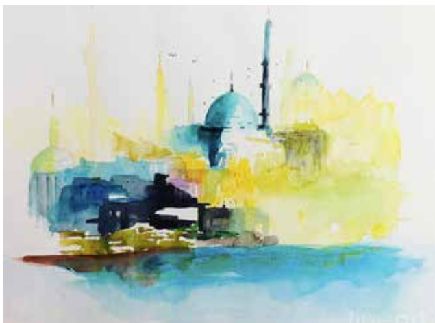
ISTANBUL. Acquerello di Gianni Raineri