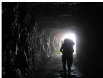
Uscita da una delle 52 gallerie

La strada è un vero e proprio capolavoro d'ingegneria militare e di arditezza, considerando anche le condizioni e l'epoca in cui fu costruita, nonché la rapidità d'esecuzione: i lavori cominciarono il 6 febbraio 1917 e furono conclusi nel novembre 1917. Fu realizzata dalla 33 a Compagnia minatori del 5 o reggimento dell'Arma del genio dell'Esercito Italiano, con l'aiuto di sei centurie di lavoratori: compagnia 349, 523, 621, 630, 765 e 776. A capo della 33 a Compagnia fu posto il tenente Giuseppe