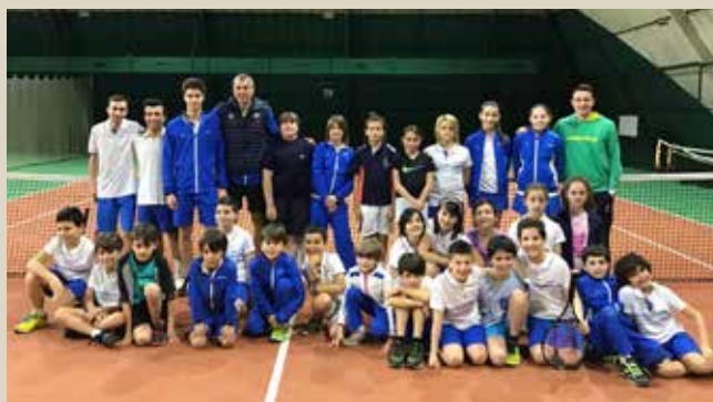
Corso di addestramento ball boys

Quali sono i suggerimenti che potrebbero rivelarsi utili a migliorare questa collaborazione?