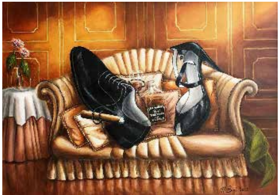
Olio su Tela di Nicoletta Bigi

tata tridimensionalità e atmosfera. L'artista acquerellista Clelia Cassaniti è di Bologna. Oltre a dipingere ad acquerello paesaggi en plein air, fiori e animali, realizza dipinti su tessuti collaborando con diverse aziende del settore. Devota alla trasparenza e alla purezza fa sì che l'opera di grande qualità e gusto tonale