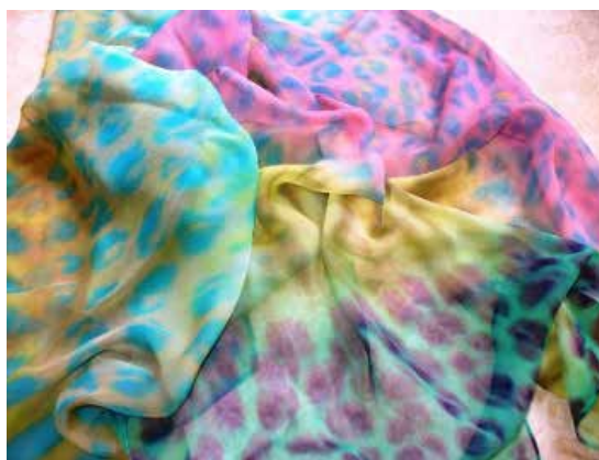
Dipinti su tela di Clelia Cassaniti

Ernesto Angelo Ubertiello in arte Quber è nato a San Severo di Foggia ma vive a Baggiovara di Modena. Diplomato al Liceo Artistico e all'Accademia di Belle Arti di Bologna, attualmente cura con altri soci la Galleria ArtEkip di Modena dove tiene corsi di pittura e percezione dell'immagine. Esporrà opere figurative di