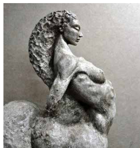
Amazzone, scultura di Michele Sassi