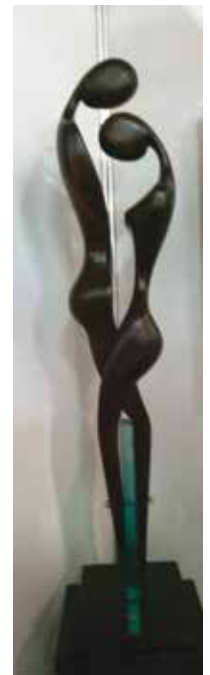
Scultura in legno di Nino Orlandi