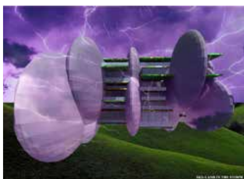
PROGETTO IN 3D DI SERGIO ZANICHELLI