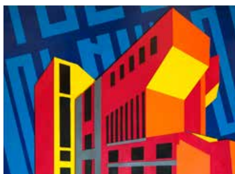
BOB RONTANI Casa Melnikov 1929