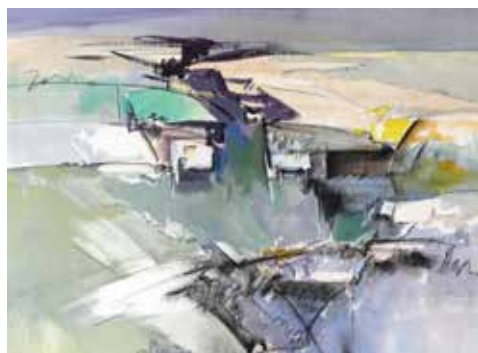
OPERA DI GIUSEPPE ZINI