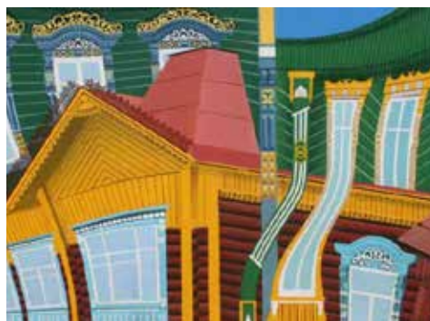
GABRIELE CASAROSA - case decorate della Russia