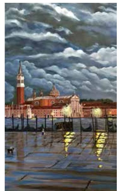
OPERA DI CRISTINA ROTASSO