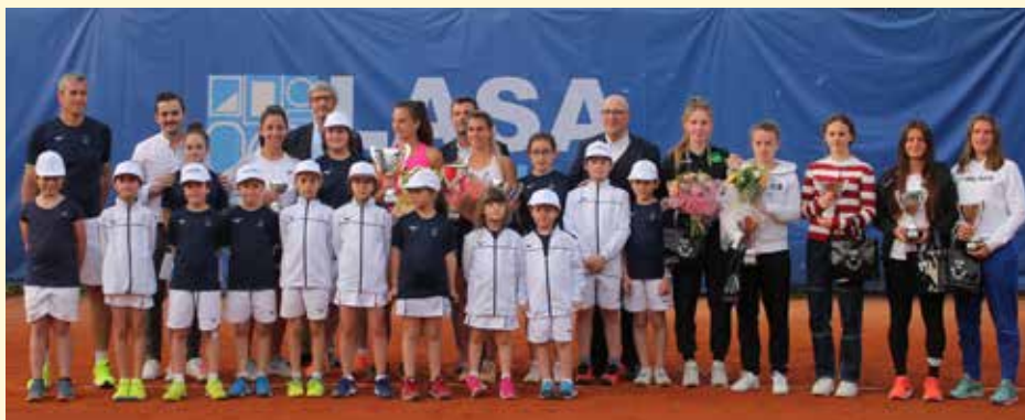
Ball Boys e Ball Girls

I ragazzi hanno vissuto un'esperienza unica stando a diretto contatto e supportando i protagonisti del torneo, vivendo l'esperienza di parte attiva dello staff ed essendo presenti ai momenti più importanti del torneo, comprese le premiazioni direttamente sul campo... i protagonisti sono stati anche loro!!!