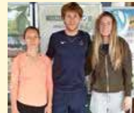
serie D femminile