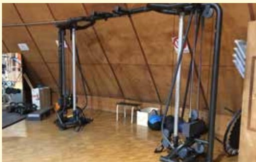
macchina cavi per arti superiori

Non è consentito ai soci appoggiare borse e zaini nello spazio riservato agli istruttori (scrivania e cassettera). Sarà invece consentito a chi accederà alla saletta corsi, portare la propria borsetta.