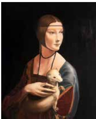
Dama con ermellino – Giulia Severi