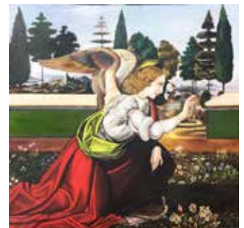
Annunciazione - Nataly Bobak