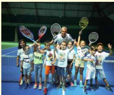
Alcuni momenti di animazione del Tennis Summer Camp 2021

- dalle 16:30 alle 18:00 doccia, merenda e ritiro dei ragazzi.