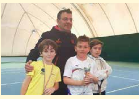
Incontri a squadre scuola tennis 2021/2021