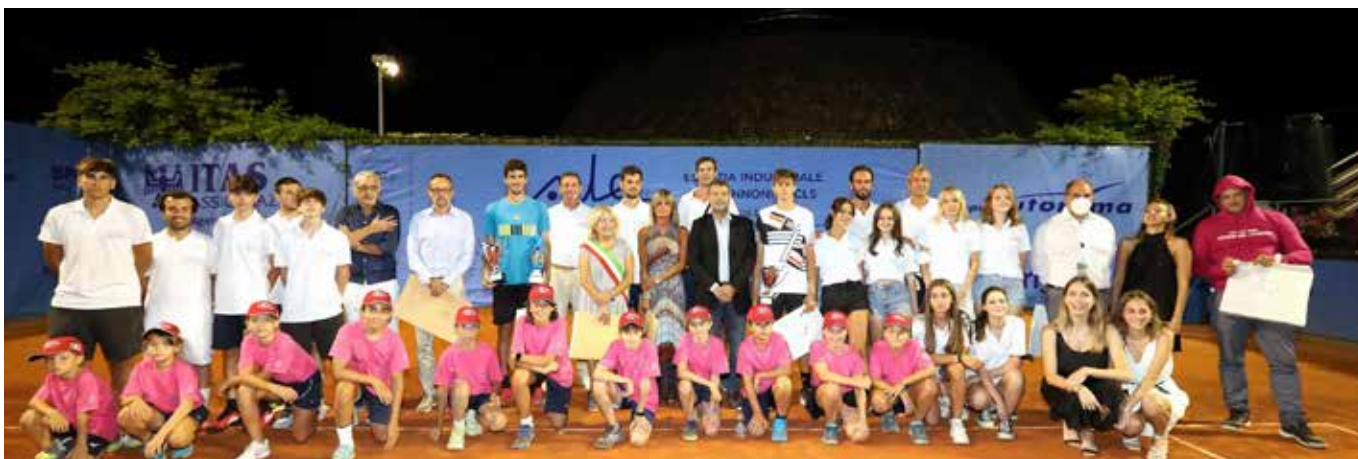
Autorità, finalisti e staff del XXXVII memorial Eugenio Fontana