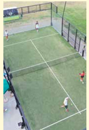
Alcuni soci del Club durante le fasi di gioco del Padel